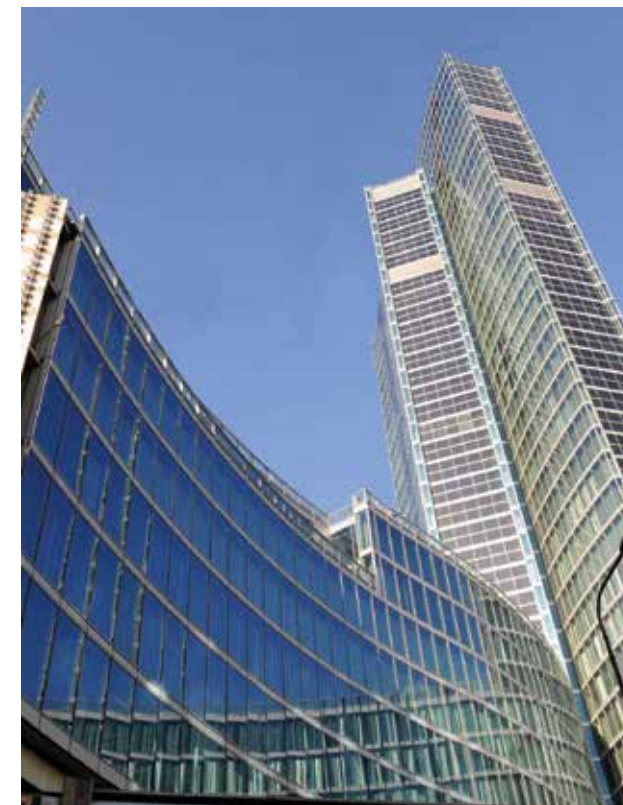
“Nuova sede di Regione Lombardia - Piazza Città di Lombardia”

IL F.C.M. NON AGISCE PER CONTO DELLA FERRARI S.p.A.